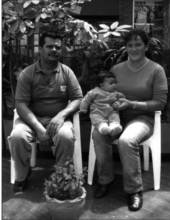
Foto 7. Donación de plantas (yerbabuena) por una familia del barrio, al Colegio Brasilia-Usume.

La estrategia de los catálogos posibilitó además proyectar el tejido social del barrio, ya que algunos estudiantes del Colegio Brasilia hacen parte de comunidades desplazadas y con la elaboración del catálogo, les permitió evocar y transmitir la memoria de diversas generaciones acerca de los usos de las plantas, reproduciendo su cultura e identidad con sus familiares (Halbwachs, 2002: 18 y Geertz, 1986: 23).