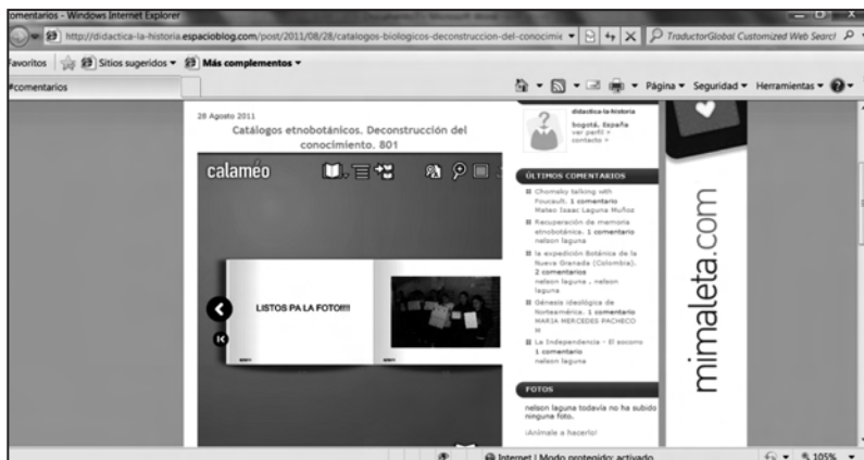
Figura 1. Blog, didáctica-la-historia, donde se muestra el resultado de la estrategia Elaboración de catálogos etnobotánicos, en el ciclo IV

La última fase fue la de socialización de los catálogos, el cual se logró no solamente en el aula frente a sus compañeros, sino también en el periódico virtual del colegio y en la elaboración de un blog donde se muestra el trabajo de los estudiantes, divulgando el conocimiento desarrollado. La consulta del blog es de carácter público, al cual tienen acceso todos los estudiantes del Colegio Brasilia-Usme, en el que pueden escribir sus comentarios y sugerencias frente a la estrategia de los catálogos y el desempeño de sus compañeros. La dirección del blog es: http://didactica-la-historia.espacioblog.com/tags/etnobotanica como en la figura 1: