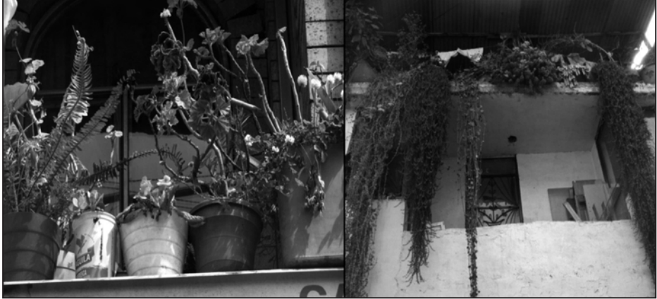
Fotos 5 y 6. Fachadas de las casas del barrio Brasilia. Localidad 5ª

La última fase fue la de socialización de los catálogos, el cual se logró no solamente en el aula frente a sus compañeros, sino también en el periódico virtual del colegio y en la elaboración de un blog donde se muestra el trabajo de los estudiantes, divulgando el conocimiento desarrollado. La consulta del blog es de carácter público, al cual tienen acceso todos los estudiantes del Colegio Brasilia-Usme, en el que pueden escribir sus comentarios y sugerencias frente a la estrategia de los catálogos y el desempeño de sus compañeros. La dirección del blog es: http://didactica-la-historia.espacioblog.com/tags/etnobotanica como en la figura 1: