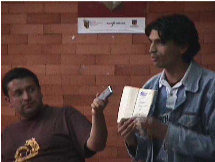
Entrevistas Manuel Elkin Patarroyo