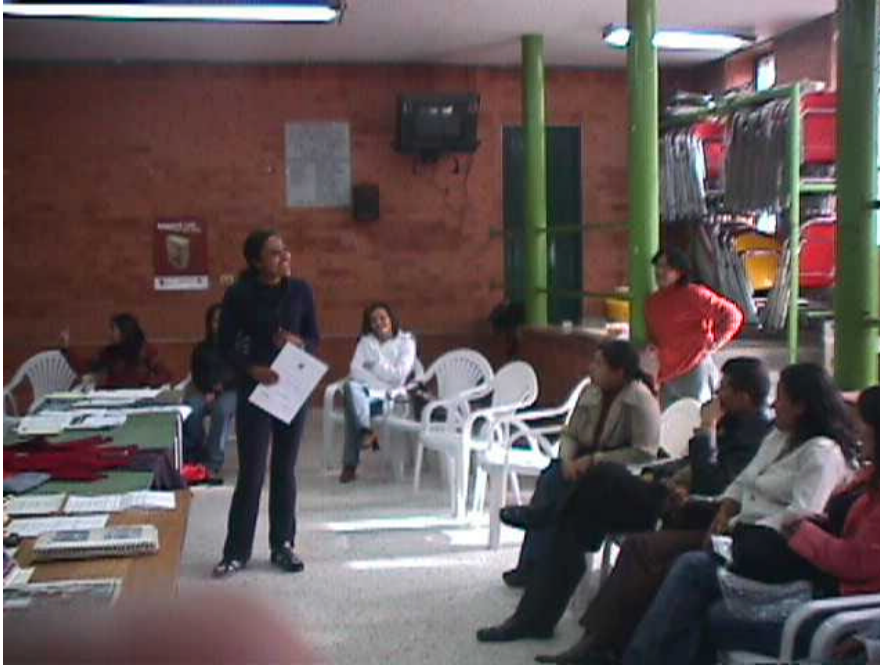
Conversatorio Manuel Elkin Patarroyo.