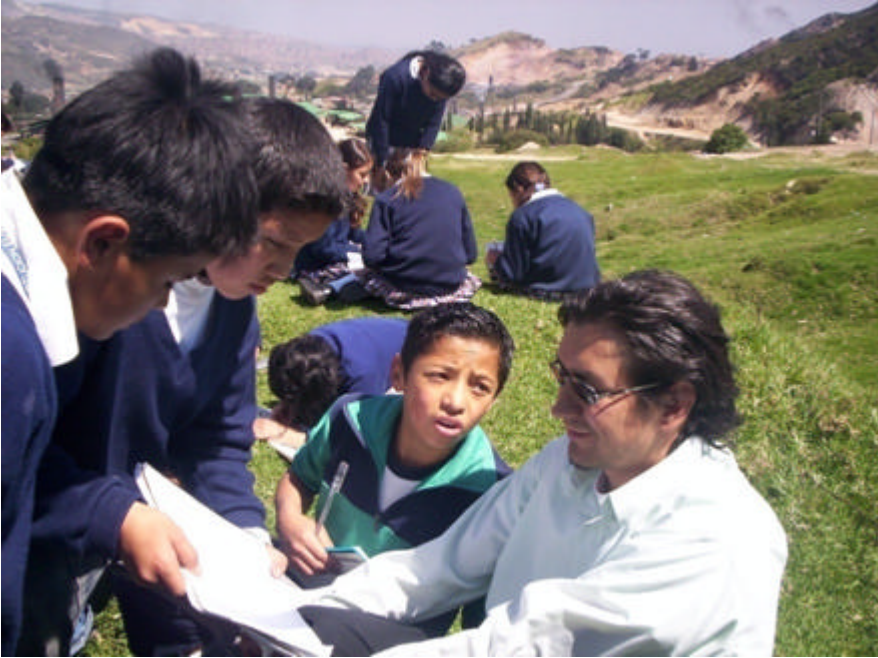
Jornadas de sensibilización.