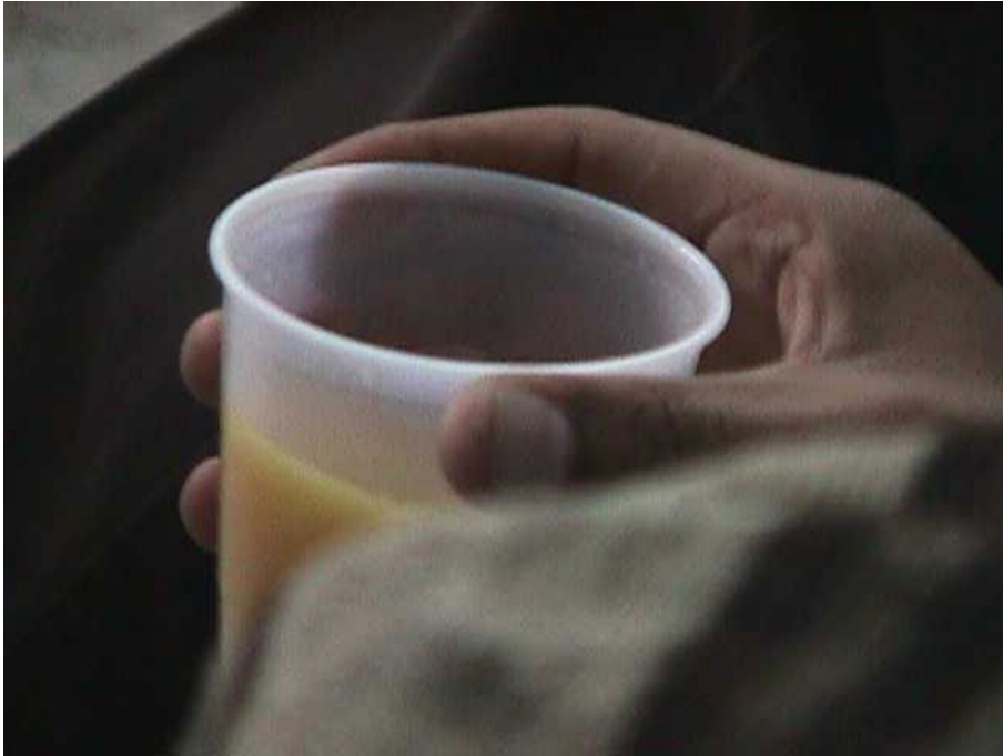
Jornada de recuperación de memoria Manuel Elkin Patarroyo