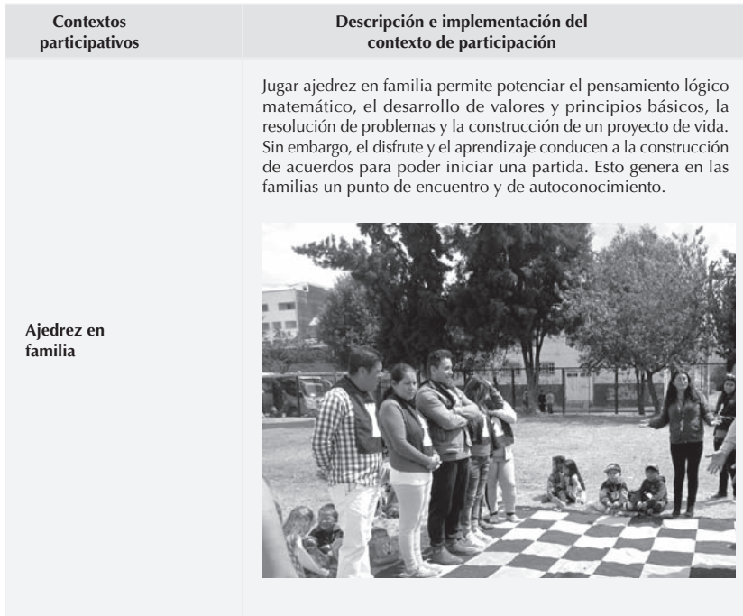
Tabla 1. Descripción de los contextos de participación con respecto al objetivo general.

En la tabla 1 se describe de forma detallada lo que se pretende con cada uno de los contextos participativos.