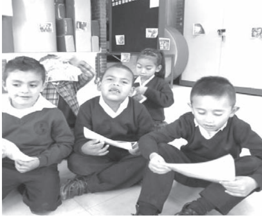
Imagen 5. Niños observando sus cuentos en imágenes.

Los cuentos inventados de los niños y niñas, respecto a las realidades de otros niños o familias, les permite identificarse directamente con los personajes y situaciones que los rodean. Asumen también el rol de actores, relatando sus imaginarios y a la vez sus realidades; pueden hablar de lo que les sucede, de cómo se sienten y de cómo podrían solucionar algún conflicto.