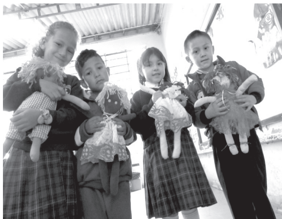
Imagen 2. Estudiantes y muñecos Rafikis.

Los muñecos Rafikis (muñecos artesanales, hechos a mano, sin estereotipos de color o género) han sido un puente entre la escuela y la familia. Esta actividad está relacionada con la promoción de la cultura y el reconocimiento de sí mismo. Este muñeco es un miembro más del aula; a través de él los niños y niñas recrean la forma de convivencia dentro y fuera de la institución (Ver Imagen 2).