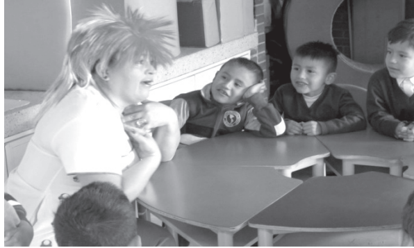
Imagen 1. Actividad en el marco de la experiencia Rafiki.

Esta experiencia pedagógica está orientada a promover cambios en las relaciones que se desarrollan dentro y fuera del aula. Asimismo, en los enfoques y en las estrategias que, en respuesta a la primera infancia, reconozcan que la diversidad es un valor y no un problema, una oportunidad y no una limitante para el encuentro entre distintos. Por esta razón, nos identificamos con el enfoque cualitativo, en tanto que los diferentes actores participan activamente en la propuesta, así Bonilla & Rodríguez (1997) señalan que “El enfoque cualitativo intenta hacer una aproximación global de las situaciones sociales para explorarlas, describirlas y comprenderlas de manera inductiva, a partir de los conocimientos que tienen las diferentes personas involucradas en ella, esto supone que los individuos interactúan”.