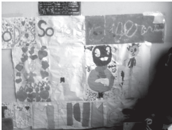
Imagen 6. "Cartografía social".

Los cuentos inventados de los niños y niñas, respecto a las realidades de otros niños o familias, les permite identificarse directamente con los personajes y situaciones que los rodean. Asumen también el rol de actores, relatando sus imaginarios y a la vez sus realidades; pueden hablar de lo que les sucede, de cómo se sienten y de cómo podrían solucionar algún conflicto.