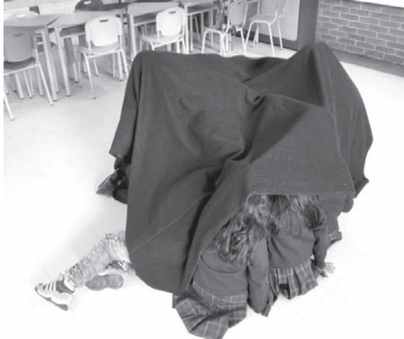
Imagen 3. Maloca hablante, hecha con una manta, linternas y cuentos.

La “ Maloca 6 hablante ” es el lugar donde los niños y niñas escriben y describen el buen uso de los valores, el respeto a la diferencia y a la palabra. En estas malocas hablantes participan los padres de familia que han sido invitados en varias ocasiones para que se vinculen a la experiencia y reflexionen acerca del respeto a la diferencia (ver Imagen 3). Este espacio de reflexión e interacción entre las familias, los docentes, niños y niñas, ha permitido el uso de la palabra de forma asertiva. Desde esta estrategia han emergido situaciones de comunicación y se ha avanzado en temas relacionados al reconocimiento del otro como sujeto por medio de la palabra.