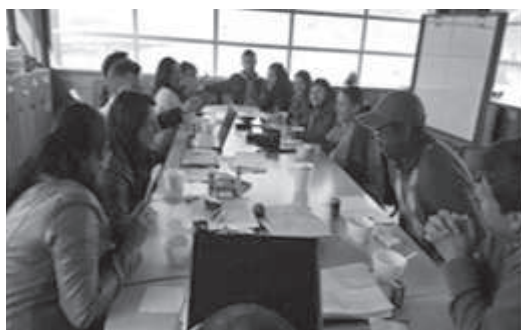
Figura 3. Construcción colectiva, de parte de los docentes, de la guía integradora de Centros de Interés