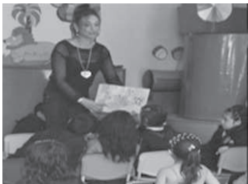
Figura 6. Socialización Centros de Interés

Socialización de los Centros de Interés de la institución, en una feria denominada Comunicarte. Luego se realizó una reflexión propositiva de la experiencia y se evaluaron los aciertos y las dificultades con miras al desarrollo de acciones de mejora, que le den al proyecto sostenibilidad en años posteriores.