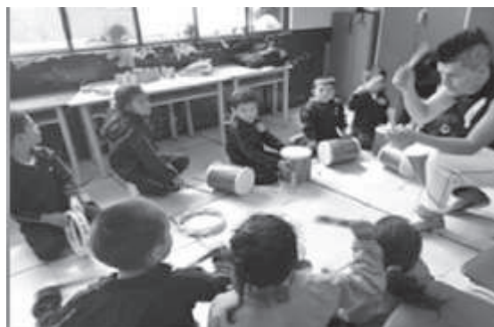
Figura 5. Participación de un padre de familia en el Centro de interés de ciclo inicial