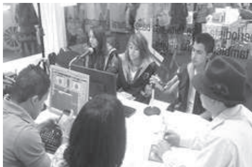
Figura 2. Padres de familia en un Centro de Interés