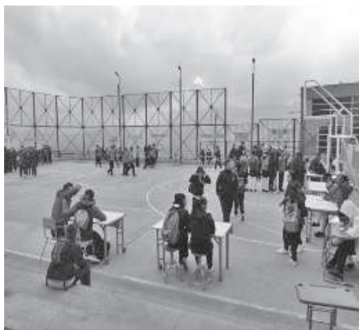
Figura 1. Estudiantes en una actividad del proyecto

La experiencia se denomina «Centros de Interés del Minuto de Buenos Aires», nombre en proceso de redefinición. Este surge de la necesidad de reflexión sobre la práctica pedagógica del docente, sobre todo de aquel que centra sus esfuerzos en brindar información de contenidos desligados del interés de los estudiantes y del contexto, lo que puede llevar a la repitencia y la deserción. Así mismo, la estrategia permite la integración del núcleo común de los ciclos con la Educación Media Fortalecida: La comunicación como medio de expresión y humanización , implementada desde 2013 en la institución.