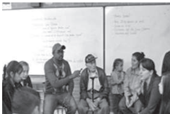
Figura 4. Historias de mi barrio, Centro de Interés del ciclo III, integrado por las áreas de inglés, música y artes escénicas.