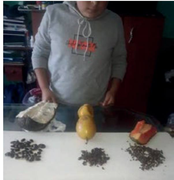
Foto 2 Elaboración del resguardo de semillas y del compost

Estas experiencias pedagógicas de los docentes de ciencias sociales inciden en los procesos formativos y en la consolidación de los sentidos de vida en la comunidad educativa, cuando se articulan a la construcción colectiva e interdisciplinar, cuando la escuela abre sus puertas a la comunidad y reconoce también, que la comunidad es un eje fundamental en los diversos procesos académicos y formativos. De igual manera, el diálogo y la construcción colectiva de conocimientos que contribuyen a la resolución de problemáticas socioambientales caracterizados por su complejidad.