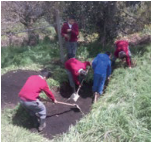
Fotografía 3 Construcción pozo cultivo de azolla

de un ejercicio llevado a cabo desde la participación de todos los grados en torno a la construcción de un espacio para la producción de azolla, un helecho de agua que se convierte en complemento alimenticio para las gallinas en el marco de la granja integral. Actualmente, este espacio se encuentra en funcionamiento, pese a la condición de pandemia vivida en este año 2020 y que ha implicado ajustes concretos de los espacios pedagógicos.