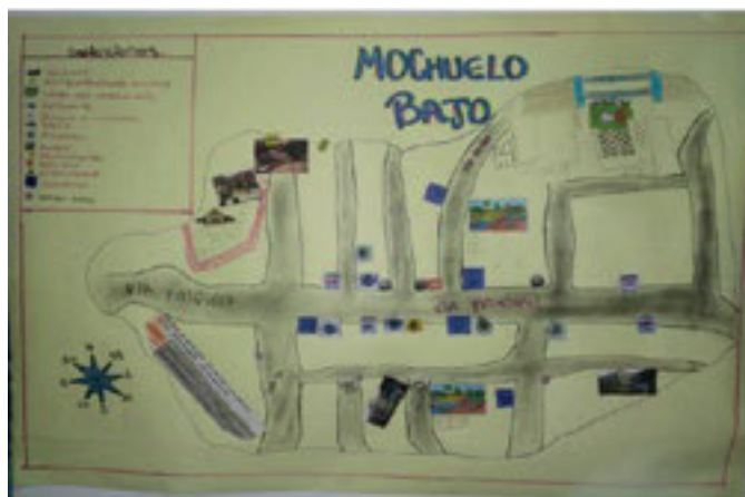
Foto 1 Mapas familiares, construcción colectiva.

Para ello, se desarrolla la cartografía familiar como instrumento que permite al estudiante y la familia ubicar elementos claves del territorio desde su conocimiento, interés y percepciones, para identificar y cartografiar su barrio, su vereda. Y es a través de las representaciones, simbologías de los estudiantes y sus familias, que se determina la forma en que perciben e interactúan en el territorio con los múltiples actores que posibilitan entender el contexto. Al identificar los elementos simbólicos que forman parte de la identidad y se elaboran leyendas, tradiciones que constituyen componentes importantes de la cultura y la identidad de las comunidades.