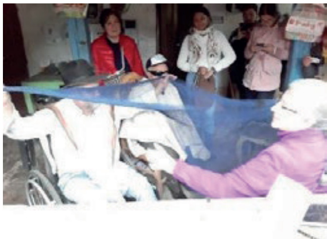
Fotografía 1 Encuentro de saberes