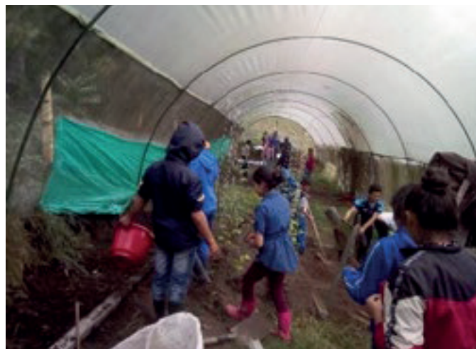
Fotografía 2 Jornada trabajo comunitario

muestra una evidencia de las jornadas de trabajo comunitario dentro de la escuela, pero importante mencionar que se llevan a cabo otras por fuera de las instalaciones de la sede.