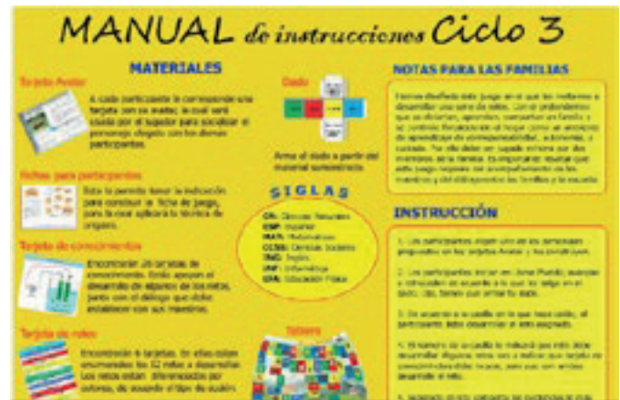
Fotografía 4 Juego de mesa interdisciplinar. Material estrategia Aprende en casa.

arriba, y a la dinamización de unas metodologías que permitieran continuar con los propósitos trazados.