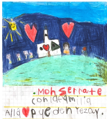
Figura 11. Monserrate con la familia