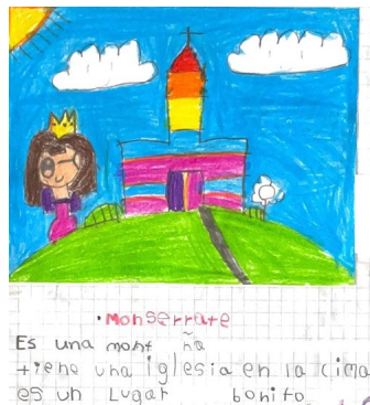
Figura 12. Monserrate

Fuente: Sara Gabriela, 6 años, transición 1.