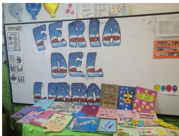
Figura 10. Exposición de creación de las niñas y los niños de primera infancia en la Feria del libro de Hervi