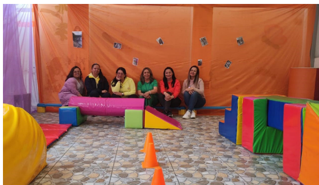
Figura 2. Colectivo Primera Infancia

Los diferentes cambios sociales, la necesidad de transformar los procesos tradicionales, el paso paulatino a la Jornada Única en el colegio y nuestro interés por la innovación, fueron elementos que nos llevaron a pensar en otra ruta metodológica para acercar a los estudiantes y sus familias a una nueva dinámica institucional en cuanto a la organización de horarios y grupos.