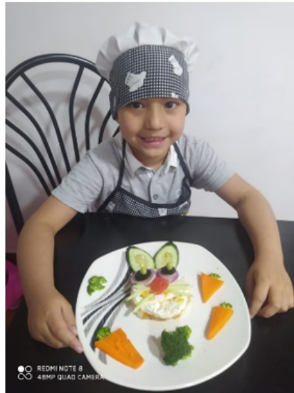
Figura 7. Obra de arte Samuel Mathías Africano- Transición 1