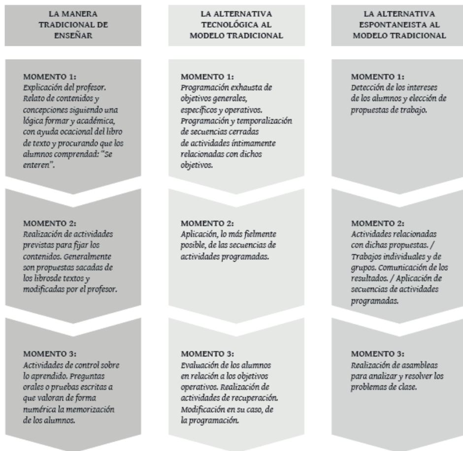
Figura 2. Esquema de los modelos pedagógicos de Porlán, R. (Porlán y Martín, 1997).

Como se puede observar, el modelo pedagógico tradicional entroniza la transmisión de contenidos conceptuales entendidos como el elemento curricular básico que condiciona los demás elementos. Mediante un ritual autoritario de obediencia y repetición el maestro cree tener la verdad absoluta y reproduce los saberes disciplinarios como productos indiscutibles. Evidentemente, son las mismas características que se reconocen en los autores anteriores y que desconocen el papel activo del alumno en el proceso de aprendizaje. Pero el aporte de Porlán es revelar que esta actuación se basa en ciertas creencias no cuestionadas