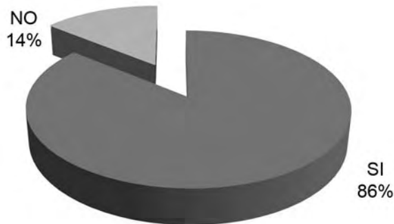
Estudiantes que han consumido alcohol con sus padres

Desafortunadamente, algunos padres no manifiestan interés real por sus hijos, sólo parcialmente: “cuando se cita al padre de familia si es que viene no quiere demorarse” 94 , se puede decir que muchos son: “padres desentendidos