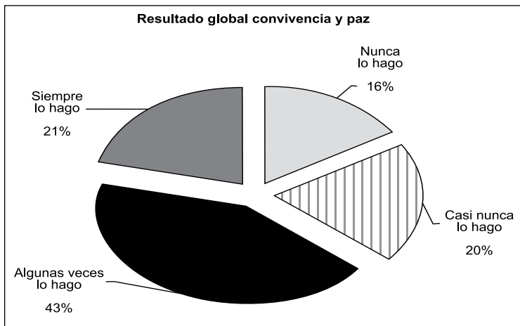
Figura 1. Respuesta a los conflictos de forma pacífica