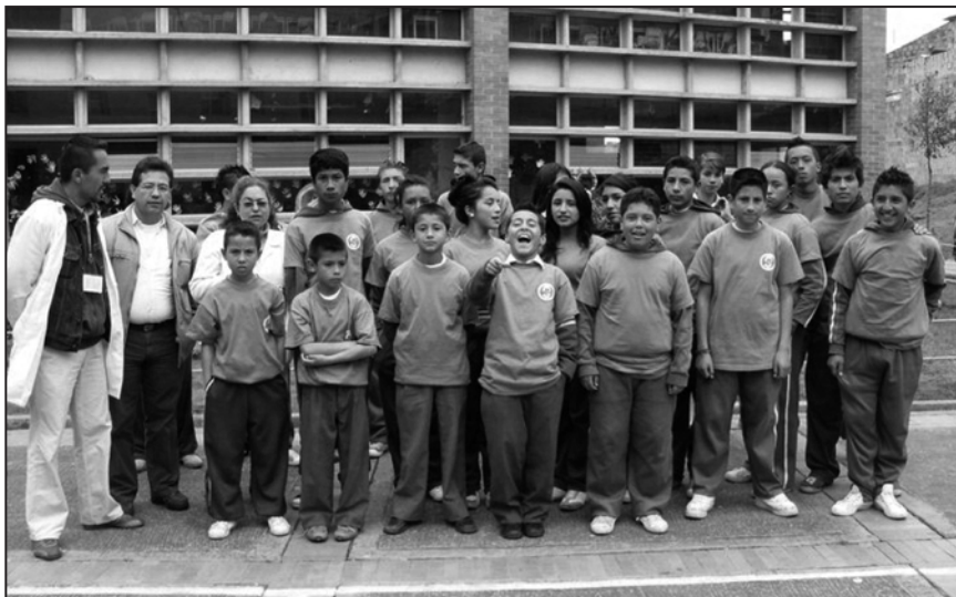
Foto 2. Escuela de mediadores