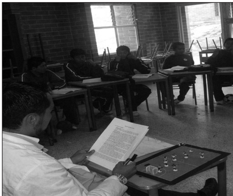
Foto 3. Talleres de formación