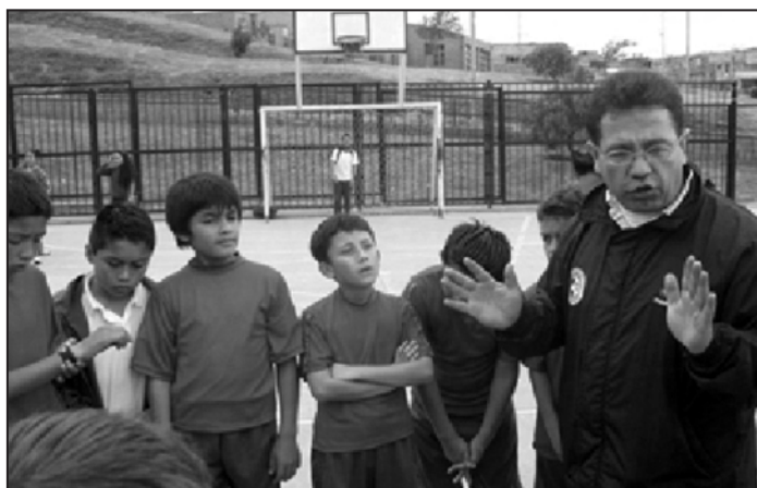
Foto 5. Formación para la resolución de conflictos

En el campo de juego y en los espacios de reflexión se promueve en los estudiantes valores como el trabajo en equipo, el respeto a su compañero y al contrario, la capacidad de autocontrol. Importantes valores educativos que se adquieren con el deporte (foto 5), si este responde a un planteamiento formativo intencionado, muchos niños habrán cambiado su actitud hacia los demás mejorando el nivel de su competencia social.