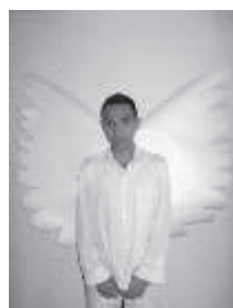
Figura 1. Cuadro de los superhéroes del colegio Bolivia sus poderes y debilidades