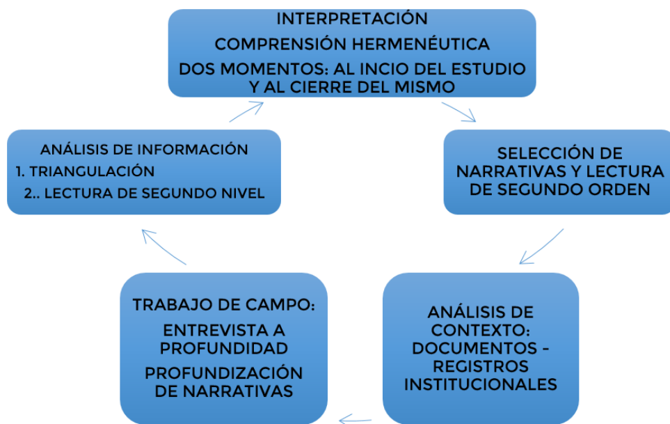
Figura 1. Proceso de selección y documentación de experiencias

Por todo lo anterior, la propuesta metodológica que desde Eisner orienta un estudio hermenéutico comprensivo para la documentación de 20 experiencias significativas en evaluación de los aprendizajes de las IE, se sintetiza en la siguiente figura: