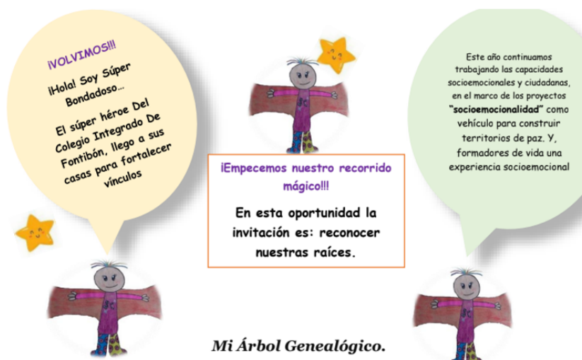
Figura 3. Taller Árbol genealógico