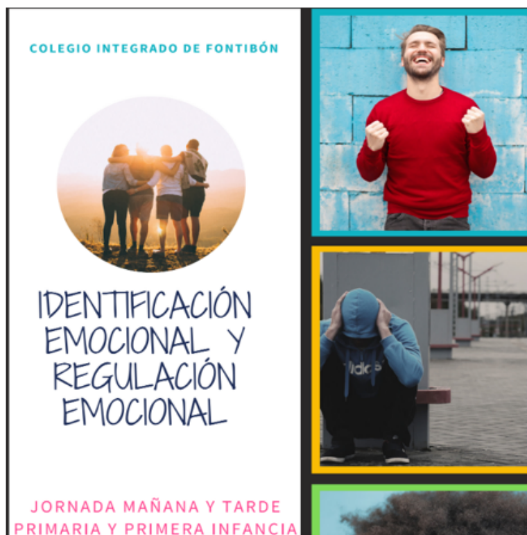
Figura 5. Cartilla manejo emociones