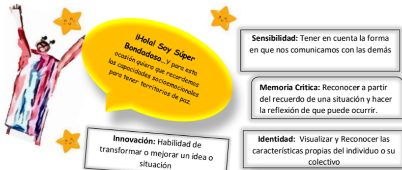
Figura 2. Primer superbondadoso