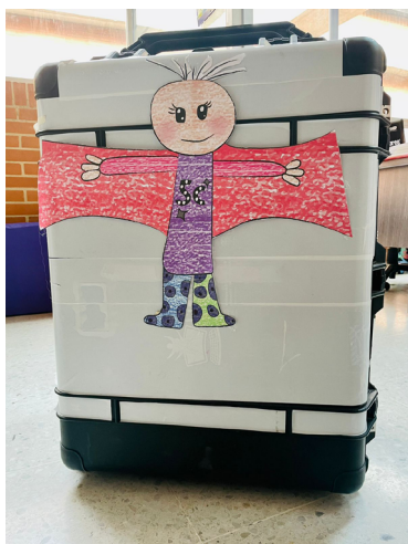
Figura 1. Maleta de la socioemocionalidad

Los grandes superhéroes -aquellos que reconocen el reto de adquirir herramientas socioemocionales y las asumen en sus prácticas de vida- reconocen que cuando se trabaja en equipo, es más fácil alcanzar los objetivos y superar los desafíos; esta lección es una parte fundamental para la misión de Superbondadoso . A lo largo de las aventuras y experiencias, se observa que como la colaboración y la cooperación son herramientas poderosas que nos permiten enfrentar los peligros de manera efectiva y lograr cambios significativos en nuestras vidas y en nuestras comunidades.