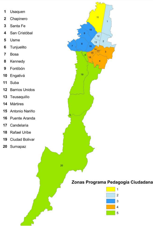
Gráfica 3 Organización por zonas de Bogotá para el Programa de Pedagogía ciudadana