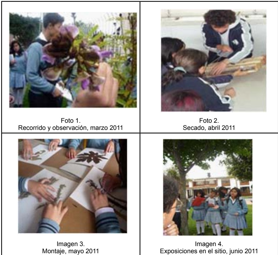
Fotos 1 a 4. Trabajo de campo.

Una vez fue elaborada la ficha técnica cada grupo hizo la exposición de la especie en el sitio, evitando gasto de papel y transcripción de datos. Esto facilitó la comparación de especies de la misma familia (foto 4). Posteriormente, se realizaron exposiciones de la investigación ante el consejo académico, a los estudiantes de la jornada y a todos los docentes de la institución; también se participó en el Foro-Feria Pedagógica 2011.