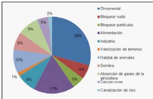
Figura 3. Usos de las plantas fuera de su valor medicinal

A la pregunta ¿con qué frecuencia usa usted las plantas medicinales? el 57% de la población usa de vez en cuando plantas medicinales y el 27% todos los días. Además del valor medicinal de las plantas el 29% conoce el uso ornamental de éstas (figura 3).