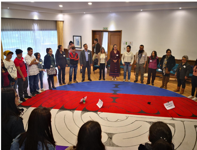
Imagen 1. Laberinto e imaginación, Maloca 2

Nota. Fuente: Autora Marina Bernal; registro gráfico, Maloca 2, Fase 4 del Programa Socioeducativo para el Abordaje Integral de la Sexualidad (2019)